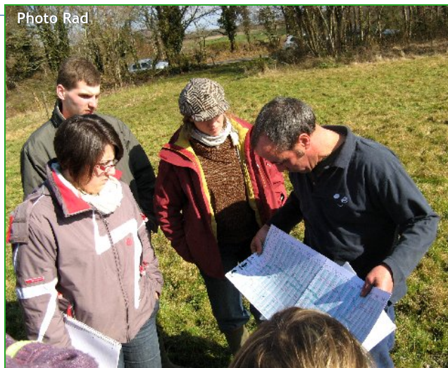
Le planning de pâturage : outil d'aide à la décision en système pâturant au même titre que le mètre ruban.